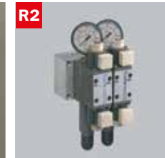
Reg. pressione morse doppio Adjustable vice pressure