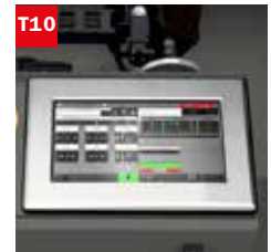
Touch screen 10" (solo per versione TOUCH) 10" touch screen (only for TOUCH mod.)