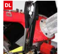
Dispositivo controllo deviazione lama Blade deflection control device