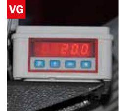
Visualizzatore gradi angolo di taglio Cutting angle display