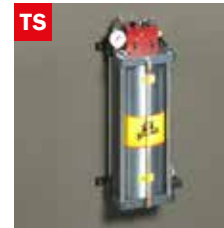
Dispositivo taglio a secco Dry cooling device